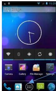
Tiroir des applications

Appuyez sur l'icône tiroir des applications pour accéder aux applications installées sur votre téléphone.